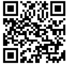
プログラム紹介動画

毎日朝食3食付き、数回のコースディナー(正装での参加) アクティビティ・エクスカージョン参加時は、現地でランチ提供あり